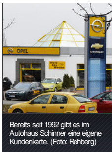
Bereits seit 1992 gibt es im Autohaus Schinner eine eigene Kundenkarte.

PDF | Weiterempfehlen | Merken | Drucken